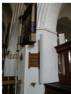
Den hvide højttaler føjer sig fint ind i pillens struktur.

I henhold til FNs Handicapkonvention, som Danmark har tilsluttet sig i 2009, er Køge Sogns Menighedsråd forpligtet på, at lydforholdene i kirken og adgangsforholdene til kirken er bedst mulige for personer med handicap.