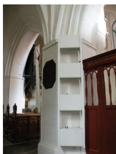
Lydanlæggets forskellige installationer ses ikke fra kirkebænken.

I henhold til FNs Handicapkonvention, som Danmark har tilsluttet sig i 2009, er Køge Sogns Menighedsråd forpligtet på, at lydforholdene i kirken og adgangsforholdene til kirken er bedst mulige for personer med handicap.