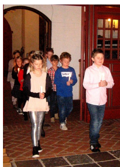
Minikonfirmander bærer lys ind i kirken ved Minikonfirmationen 3. dec. 2011

Med udgangspunkt i Bjørn Nørgaards gobelinskitse Reformationen skal eleverne dykke ned i den række af begivenheder, der midt i 1500-tallet ændrede kristendommen dramatisk.