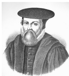
Peder Palladius (1503-1560) var den første lutherske biskop over Sjællands Stift

Med udgangspunkt i Bjørn Nørgaards gobelinskitse Reformationen skal eleverne dykke ned i den række af begivenheder, der midt i 1500-tallet ændrede kristendommen dramatisk.