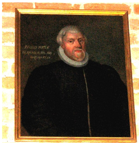
Biskop Poul Madsens portræt hænger i Roskilde Domkirke.

Da der var gået 7 år, blev han 1569 forflyttet og kom til at beklæde bispeembedet over alle bispeembeder som den